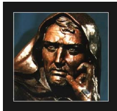
Statua celebrativa in bronzo, opera di G. Canone

“...non devo nè voglio pentirmi, non ho di che pentirmi né ho materia di cui pentirmi, e non so di che cosa mi debba pentire...”