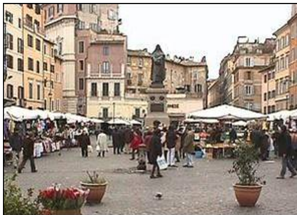
Monumento a Campo de’ Fiori in Roma, opera di Ettore Ferrari

Le opere filosofiche più importanti, nelle quali difende la filosofia di Copernico vennero pubblicate a Londra: “La cena delle ceneri” (1584), “De la causa, principio et uno” (1584), “De l’infinito universo et mondi” (1584) ed una commedia dal titolo “Il Candelaio” (1582).