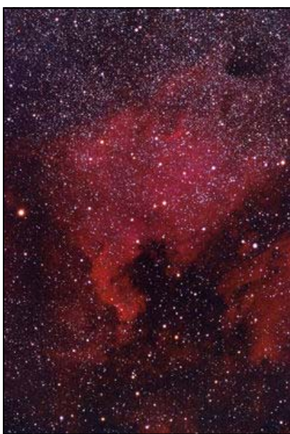
Nebulosa Nord America

Un'altra stella interessante è 61 Cygni, al limite della visibilità a occhio nudo; è una stella molto vicina (solo 11 anni luce) e storicamente importante in quanto fu la prima di cui si riuscì a misurare la distanza (Bessel nel 1838). 61 Cygni si muove in direzione del Sistema Solare alla velocità di 60 chilometri al secondo, ed è uno dei primi sistemi stellari in cui siano stati scoperti pianeti.